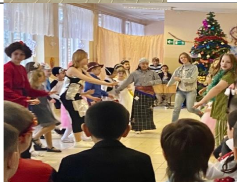
Спектакль по произведению Д.Фонвизина «Недоросль»