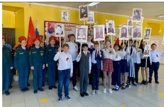
Акция «Георгиевская ленточка»